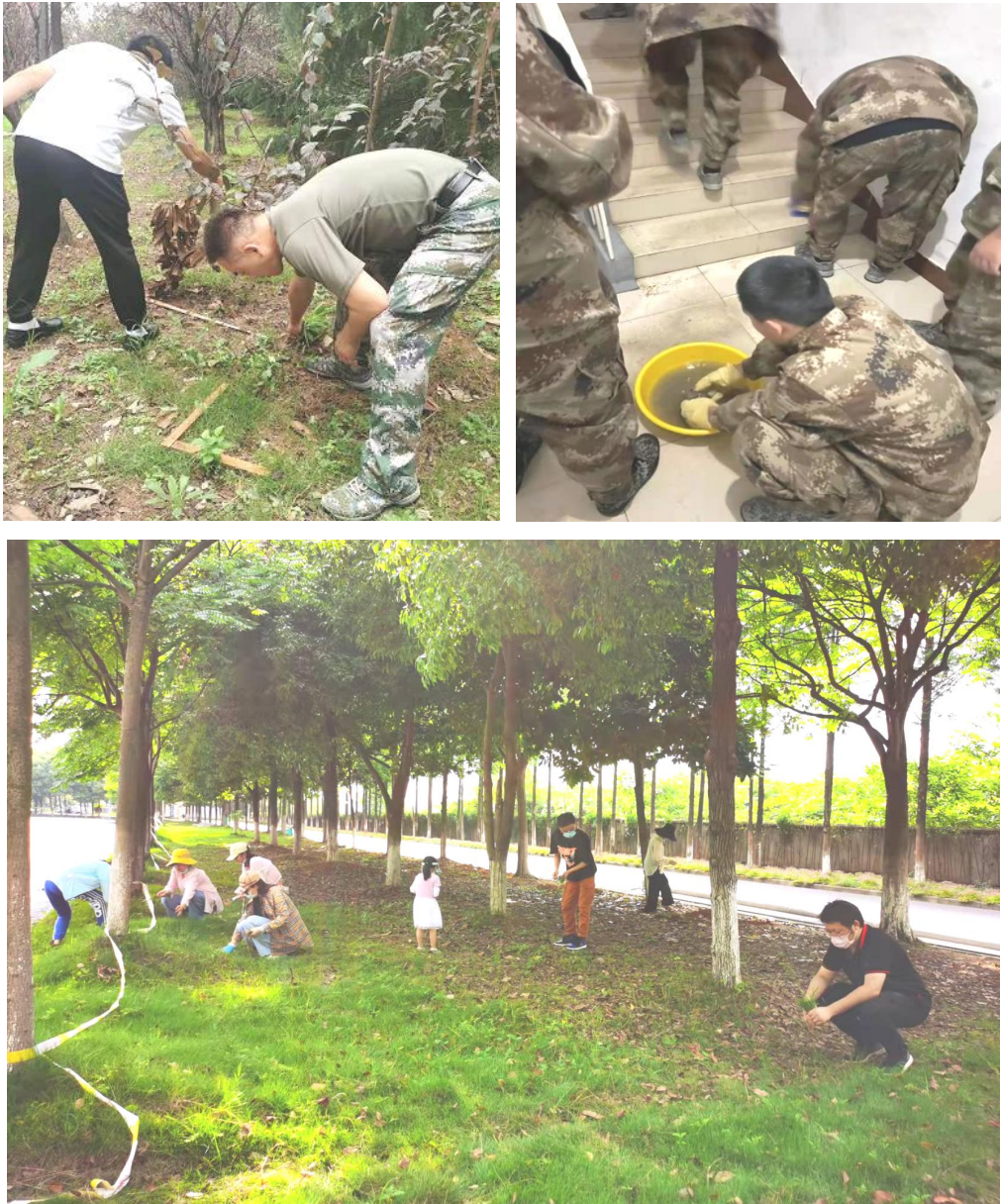
图 1 为全校师生共建劳动美化校园