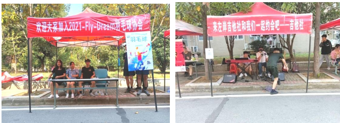
表 2-5 2020 年武昌职业学院世界技能大赛获奖情况

新生开学可以加入自己喜欢的社团，丰富美好的大学时光，同学们积极响应纷纷加入，既可培养自己的兴趣爱好，也可以使自己的兴趣爱好得以更好的展现。