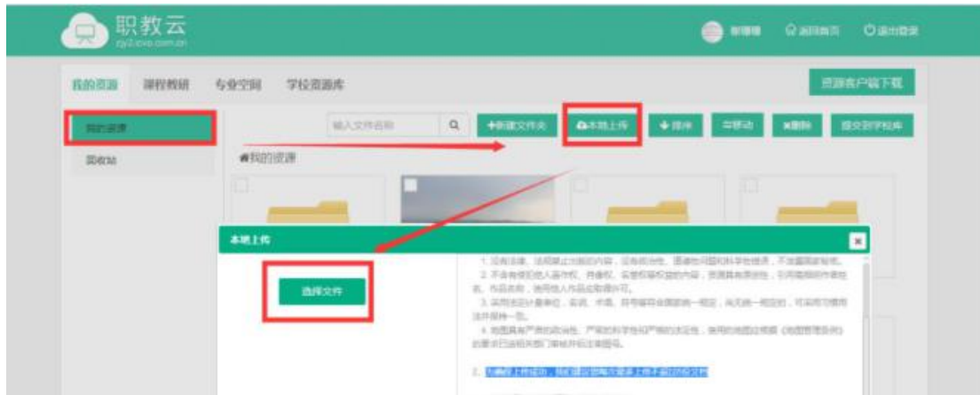
图 3 为职教云平台

两种线上教学模式，既保证学生远程及时参与课堂学习，同时又支持学生查阅丰富的学习资源，并且能检验自己的学习效果。