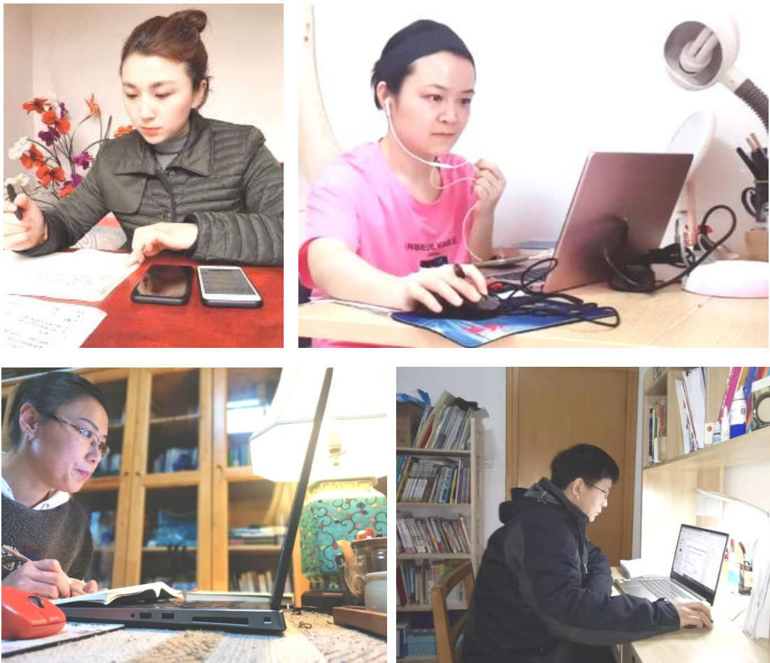
图 2 为教师线上教学准备教师进行线上教学

第一种是使用钉钉课堂或者腾讯会议平台，教师“化身”为线上主播，开设课堂，进行连线视频直播教学环节，一批教师以成为“网红”教师而感到自豪和骄傲。